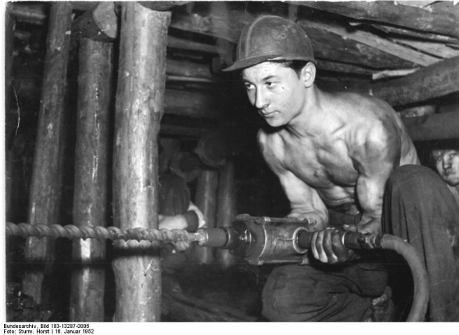
Abbildung 2: Bergarbeiter Sprenglöcher bohrend

nes Grundeinkommen vom republikanischen Präsidenten Nixon vorgeschlagen und vom Repräsentantenhaus angenommen [7]. Das bedingungslose Grundeinkommen wie beispielsweise von Götz Werner vorgeschlagen würde Einkommen und Arbeit entkoppeln und deshalb wirtschaftliche und politische Teilhabe auch unter den Rahmenbedingungen einer weitgehenden Automatisierung ermöglichen [8].